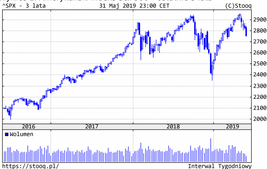
Wykres 1. Amerykański indeks S&P500 - ostatnie 3 lata

Maj nie był aż tak udany na rynkach finansowych, jak poprzednie 4 miesiące. Nie doszło do zawarcia porozumienia handlowego pomiędzy USA a Chinami. Co więcej, obie strony przyjęły zdecydowane kroki, które na pewien czas ograniczają możliwość zawarcia takiego porozumienia (np. embargo na Huawei). Nie pomagała również nadaktywność medialna prezydenta Trumpa, którego tweety wywoływały spore zamieszanie , doprowadzając do sporej przeceny amerykańskich akcji. Mimo tego S&P500 od początku br. zyskał 9,8%, a Nasdaq 12,3%. Niemiecki DAX po maju jest 11,1% na plusie.