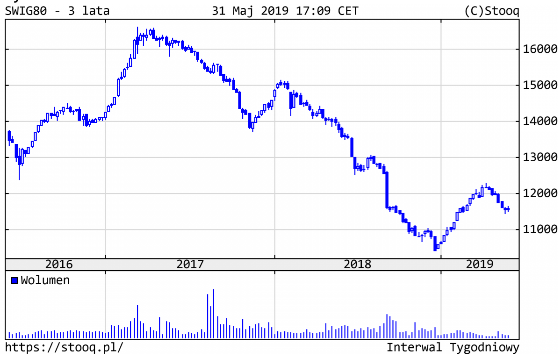
Wykres 3. SWIG80 w 2018 r. - ostatnie 3 lata

Notowania średnich i mniejszych spółek - zgodnie z naszymi oczekiwaniami - były bardziej odporne na spadki. SWIG80 urósł w br. o 9,5%.