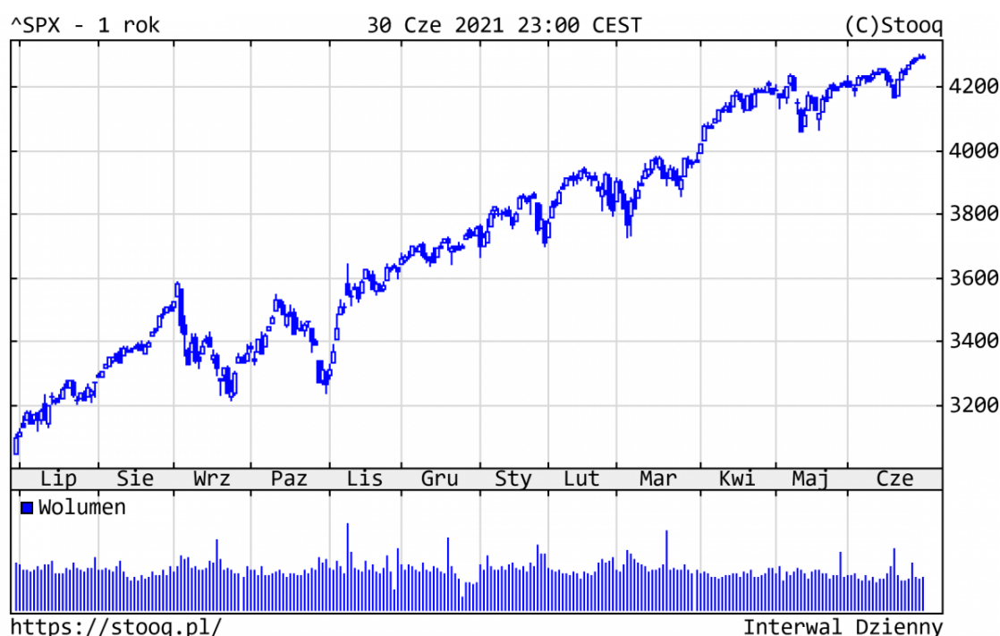
Wykres 1. S&P500 - ostatni rok

Wydarzeniem czerwca był rekord wszech czasów na GPW w Warszawie. WIG poprawił osiągnięcie sprzed 14 lat. Na rynkach zagranicznych główne indeksy również pobiły historyczne maksima, a do łask wróciły spółki technologiczne. Od początku roku indeksy osiągnęły następujące stopy zwrotu: S&P500 +14,4%, DAX +13,2%, Nasdaq +12,5%.