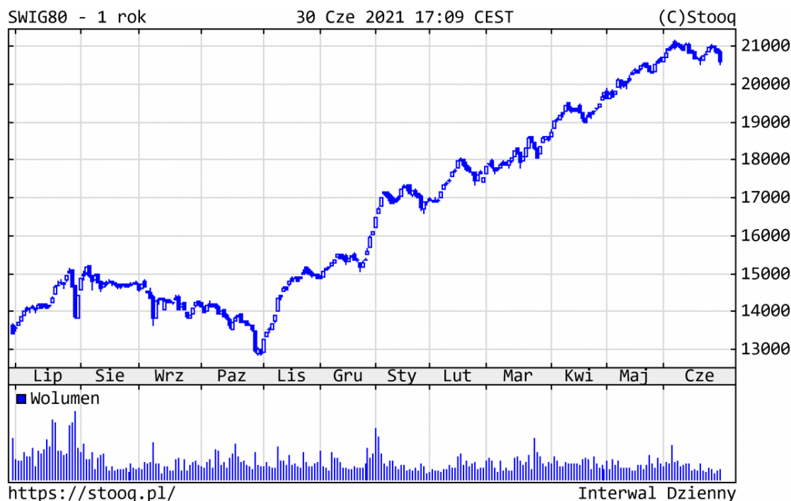
Wykres 4. sWIG80 - ostatni rok

Dobłą passę utrzymywał cały szeroki rynek polskich spółek. Ponad 100 z nich podrożało w br. już o 53% (!) i więcej. sWIG80 zyskał 27,9%, pozytywnie wyróżniając się na tle indeksów giełdowych na całym świecie . Z najlepiej zachowujących się walorów warto wyróżnić m.in.: Mabion (+236%), Serinus (+214%), Asbis (+173%) czy sektor budowlany, na czele z Erbudem (+221%).