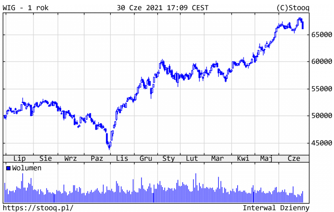
Wykres 3. WIG - ostatni rok

WIG, główny indeks GPW, zyskał w br. 15,9%. Z blue chips od początku roku najlepiej zachowywały się LPP (+55%), banki (Pekao +52%) i sektor energetyczny (PGE +45%). Na drugim biegunie znalazły się spółki technologiczne (CD Projekt - 31% i Allegro -23%), które w samym czerwcu odrobiły część strat.