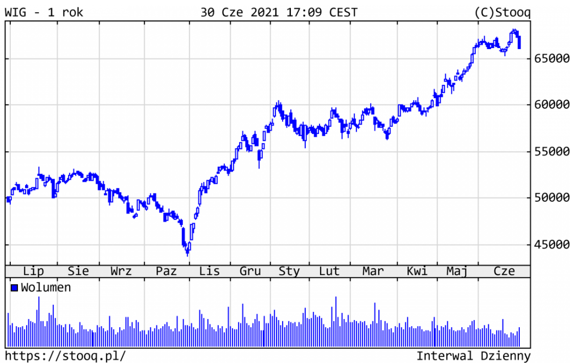
Wykres 3. WIG - ostatni rok

WIG, główny indeks GPW, zyskał w br. 15,9%. Z blue chips od początku roku najlepiej zachowywały się LPP (+55%), banki (Pekao +52%) i sektor energetyczny (PGE +45%). Na drugim biegunie znalazły się spółki technologiczne (CD Projekt -31% i Allegro -23%), które w samym czerwcu odrobiły część strat.