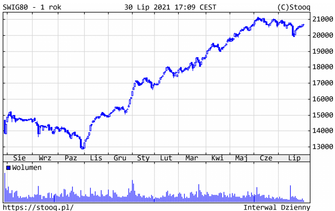
Wykres 3. sWIG80 - ostatni rok

W trendzie bocznym w lipcu znalazł się również szeroki rynek polskich spółek. Od początku br. ponad 100 z nich podrożało już o 61% (!) i więcej, a sWIG80 zyskał 28,4%, pozytywnie wyróżniając się na tle indeksów giełdowych na całym świecie. Z najlepiej zachowujących się walorów warto wyróżnić m.in.: Serinus (+271%), Mabion (+203%), Asbis (+191%) czy sektor budowlany, na czele z Erbudem (+215%).