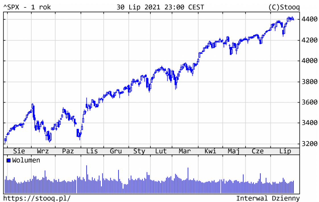
Wykres 1. S&P500 – ostatni rok

Wydarzeniem lipca był nowy rekord wszech czasów na amerykańskim rynku akcji i mocne zachowanie obligacji. Dzięki bardzo dobrym wynikom spółek za II kwartał, główne indeksy w Nowym Jorku pobiły historyczne maksima. Od początku roku osiągnęły one następujące stopy zwrotu: S&P500 +17,0%, Nasdaq +13,9%, a niemiecki DAX +13,3%.