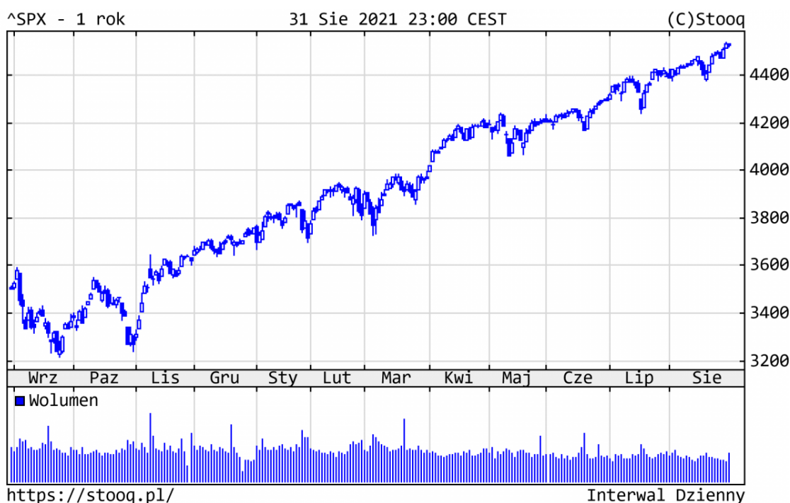
Wykres 1. S&P500 - ostatni rok

Wydarzeniem sierpnia były kolejne nowe rekordy wszech czasów na amerykańskim i polskim rynku akcji. WIG pokonał poziom 70 tys. punktów. Mimo okresu wakacyjnego, inwestorzy nadal kontynuowali zakupy akcji, korzystając z ultra luźnej polityki banków centralnych i odbicia w globalnej gospodarce. Od początku roku światowe indeksy osiągnęły następujące stopy zwrotu: S&P500 +20,4%, Nasdaq +18,4%, a niemiecki DAX +15,4%.