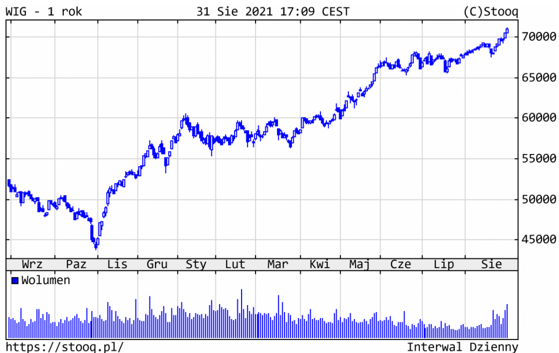
Wykres 2. WIG - ostatni rok

technologiczne (CD Projekt -37% i Allegro -16%).