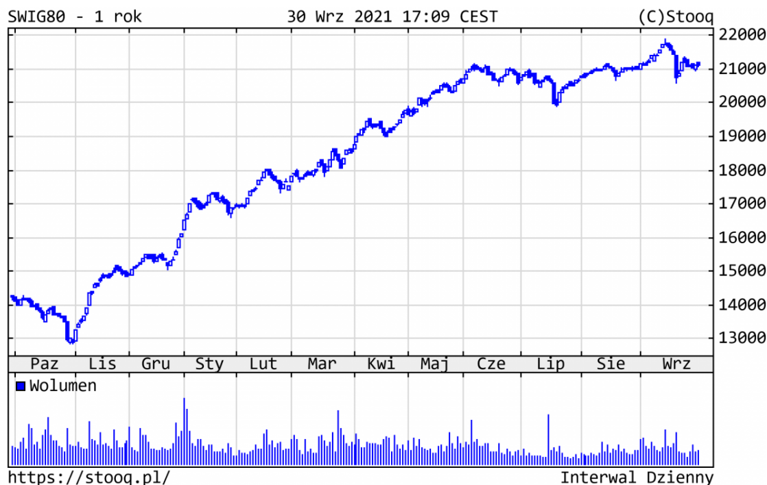
Wykres 4. sWIG80 - ostatni rok

Szeroki rynek polskich spółek pozostawał w 3Q21 w trendzie bocznym. Od początku br. ponad 100 z nich podrożało o 60% i więcej, a sWIG80 zyskał 31,3%, cały czas pozytywnie wyróżniając się na tle różnych indeksów giełdowych. Z najlepiej zachowujących się walorów warto wyróżnić m.in.: Serinus (+253%), Mabion (+247%), Asbis (+211%), czy sektor budowlany, na czele z Erbudem (+182%).