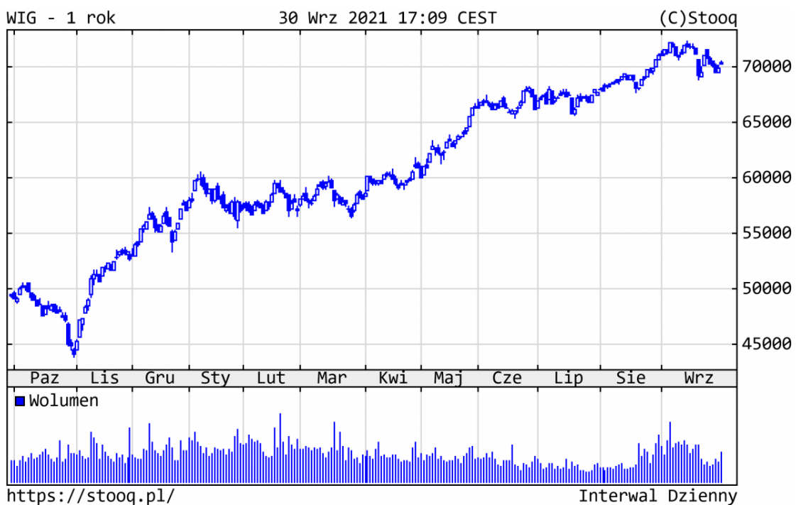
Wykres 3. WIG - ostatni rok

Główny indeks GPW od początku br. jest na dużym plusie (+23,4%). Z blue chips od początku roku najlepiej zachowywały się: JSW (+115%), LPP (+85%) i Pekao (+74%). Na drugim biegunie znalazły się spółki technologiczne (CD Projekt -28% i Allegro -32%).