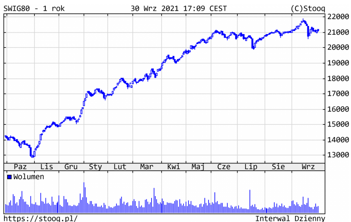
Wykres 3. sWIG80 - ostatni rok

Szeroki rynek polskich spółek pozostawał w trendzie bocznym czwarty miesiąc z rzędu. Od początku br. ponad 100 z nich podrożało o 60% i więcej, a sWIG80 zyskał 31,3%, cały czas pozytywnie wyróżniając się na tle różnych indeksów giełdowych. Z najlepiej zachowujących się watorów warto wyróżnić m.in.: Serinus (+253%), Mabion (+247%), Asbis (+211%), czy sektor budowlany, na czele z Erbudem (+182%).