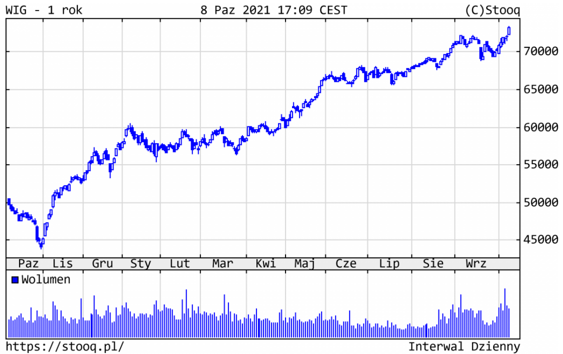
Wykres 2. WIG - ostatni rok