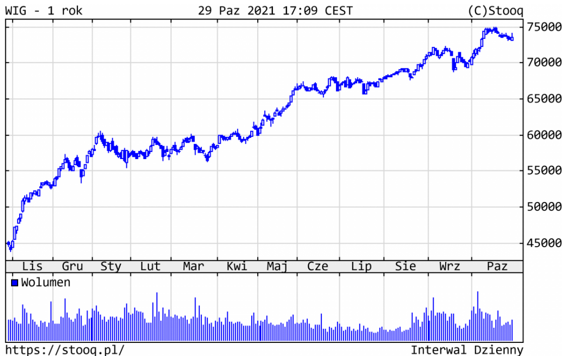
Wykres 2. WIG - ostatni rok

rosnących oczekiwań co do kolejnych podwyżek stóp procentowych przez RPP. Od początku roku WIG zyskał +29,0%. Z blue chips najlepiej zachowywały się właśnie banki, a w szczególności Pekao (+122%) i Santander (+101%). Na drugim biegunie znalazły się spółki technologiczne: CD Projekt -35% i Allegro -47%.