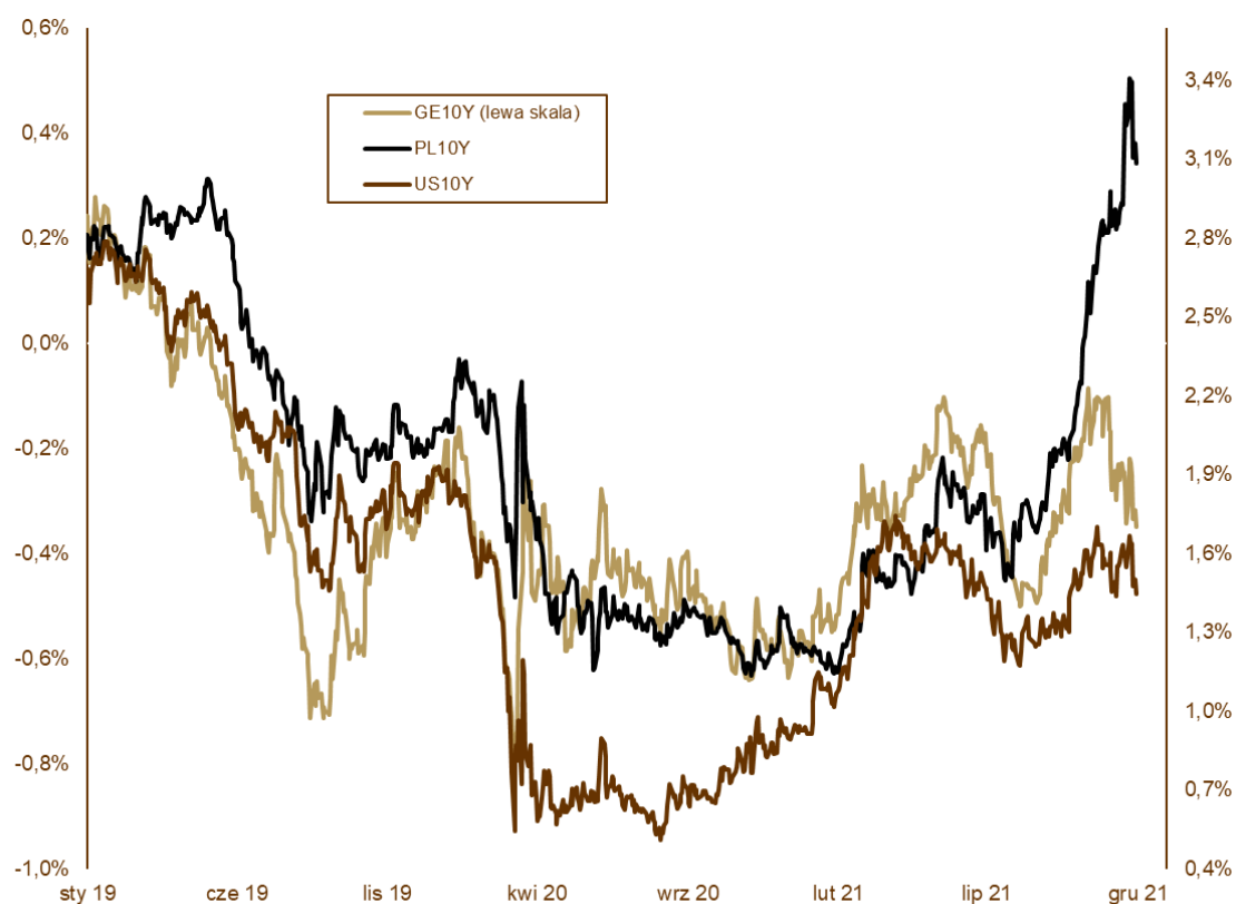
WYKRES 2. Zmiany rentowności 10-letnich obligacji skarbowych.

inflacją, dochodzi do stopniowej zmiany narracji w polityce pieniężnej. Prezes amerykańskiej Rezerwy Federalnej J. Powell zapowiedział, że inflacja nie jest przejściowa, a jej charakter jest bardziej uporczywy. Przesunęło to oczekiwania na szybsze wychodzenie ze stymulacji monetarnej (tzw. tapering) i podniosło oczekiwania na podwyżki stóp procentowych w USA. Na ten moment spekuluje się o 2-3 podwyżkach w przyszłym roku, z których pierwsza może nastąpić już w pierwszym półroczu. Końcówka miesiąca przyniosła negatywne wieści z frontu pandemicznego. Odkrycie nowego wariantu Omikron, spowodowało przecenę na rynkach akcyjnych, spadek cen ropy naftowej i wzrosty cen obligacji, postrzeganych jako bezpieczna przystań. I ten właśnie efekt zdecydował o całym miesiącu. Rentowność amerykańskich, 10-letnich obligacji skarbowych spadła w listopadzie z 1,56% do 1,45%, a niemieckich z -0,11% do -0,35%.