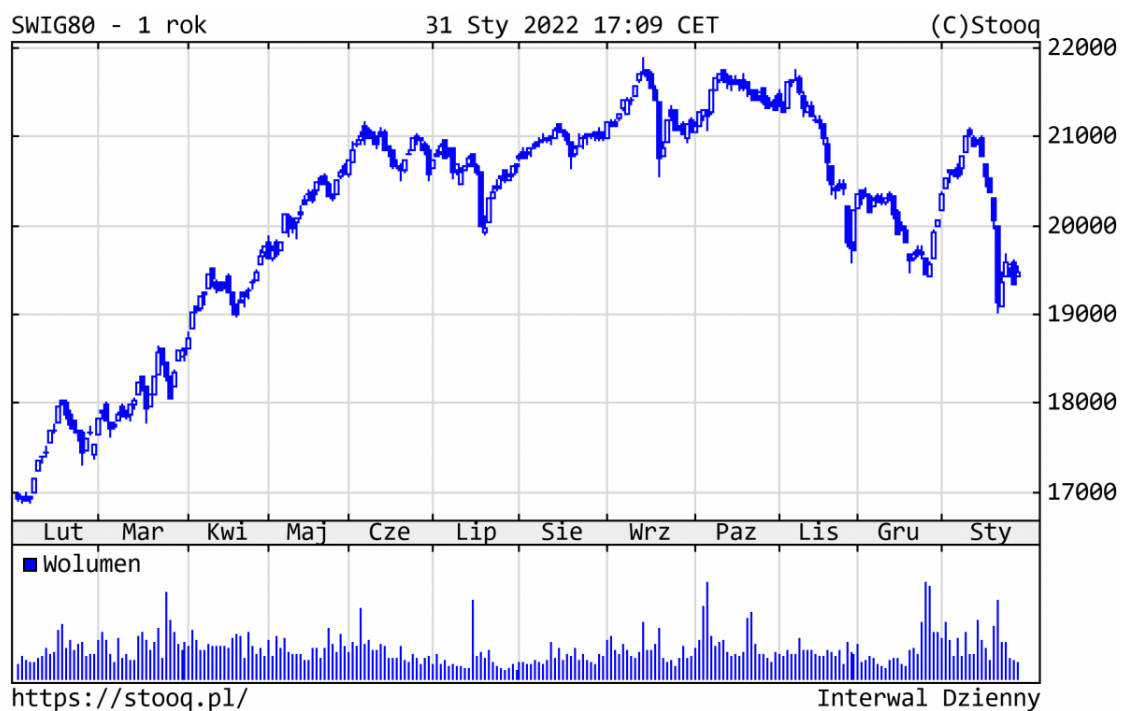
Wykres 3. sWIG80 - ostatni rok

Szeroki rynek polskich spółek zachował się podobnie - najpierw wzrost, później spadek. sWIG80 stracił 2,9%. Z najlepiej zachowujących się walorów można wskazać m.in. BBI Development (+40%). Na drugim biegunie znalazł się m.in. Ten Square Games (-28%).