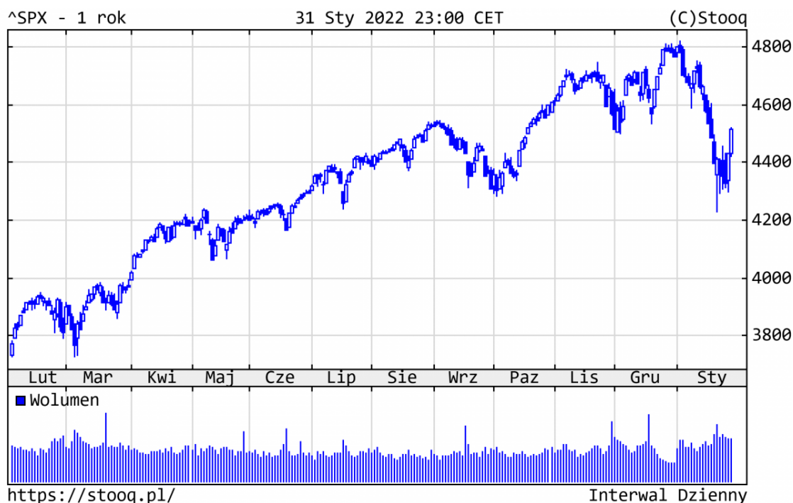
Wykres 1. S&P500 - ostatni rok

W styczniu najważniejszym wydarzeniem na rynkach finansowych była korekta notowań na amerykańskim rynku akcji, będąca wynikiem normalizacji polityki pieniężnej przez Fed i dostosowania się poziomu cen po bardzo udanym roku 2021. Tamtejsze indeksy giełdowe zanotowały spore spadki: S&P500 o 5,3%, Nasdaq o 9,0%. W Europie sytuacja była nieco stabilniejsza, niemiecki DAX zniżył o 2,6%.