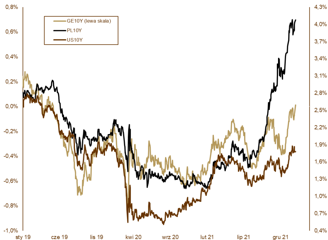
WYKRES 2. Zmiany rentowności 10-letnich obligacji skarbowych.

cenami włączył się rząd ustanawiając dwie tarcze (anty)inflacyjne. Obniżki podatku VAT i akcyzy na wybrane dobra (m.in. żywność, paliwa, energia elektryczna) powinny obniżyć tegoroczną ścieżkę o ok. 1,5 punktu procentowego. Czas obowiązywania tarcz został wydłużony do końca lipca, ale z dużym prawdopodobieństwem można zakładać, że część obniżek podatków zostanie z nami na dłużej, tak aby wyskok inflacji po ustaniu tarcz nie był zbyt gwałtowny. Warto też zauważyć, że tarcze, mimo że z nazwy są antyinflacyjne, to obniżają CPI tylko w krótkim terminie. W dłuższym horyzoncie działają proinflacyjnie, pozostawiając więcej środków w rękach gospodarstw domowych. W styczniu polskie obligacje zachowywały się słabo, o czym wspomnieliśmy w pierwszej części komentarza. Rentowność 10-letnich obligacji skarbowych wzrosła z 3,65% do 4,08%, 5-letnich z 3,95% do 4,06%, a dwulatek z 3,36% do 3,62%, mimo że w trakcie miesiąca były kwotowane z rentownością poniżej 3%.