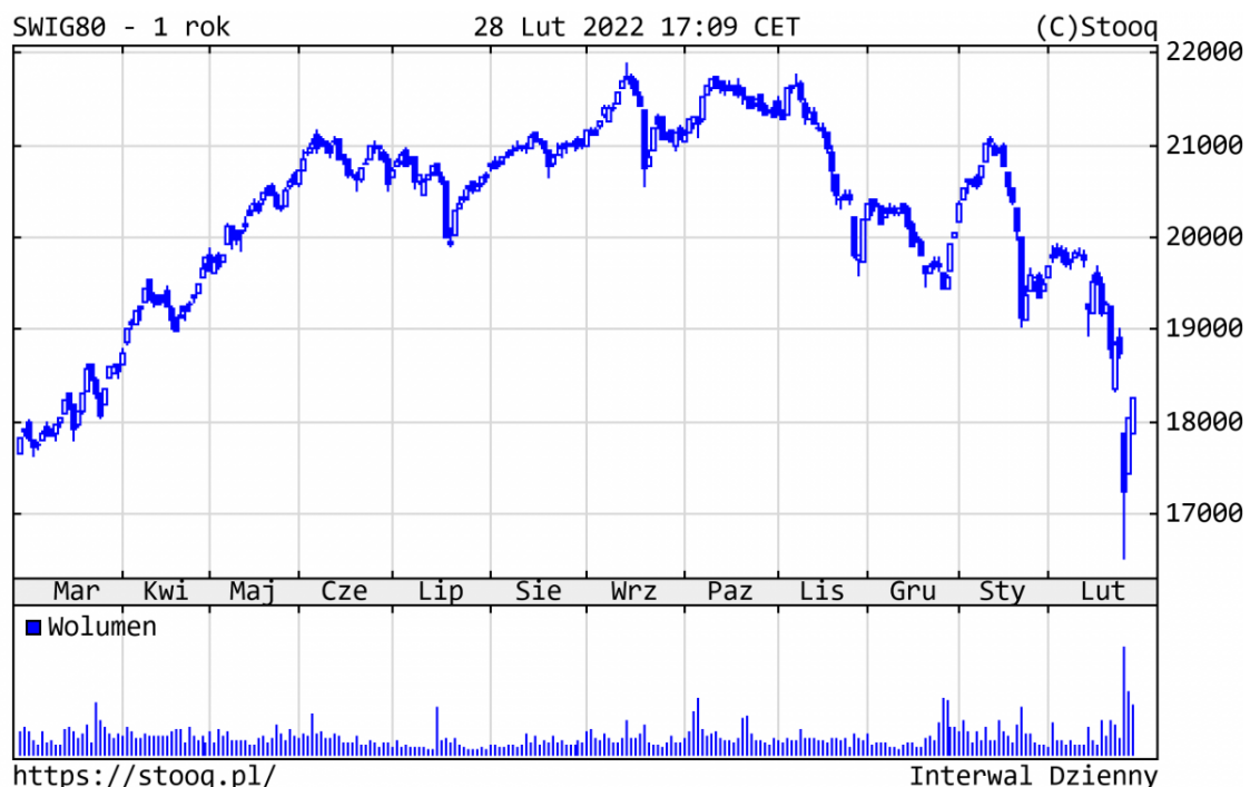
Wykres 3. sWIG80 - ostatni rok

Szeroki rynek polskich spółek zachował się podobnie , sWIG80 spadł o 9,0%. Najbardziej na wartości straciły spółki ukraińskie, jak Astarta (-46%) czy Kernel (-46%), a z innych podmiotów TEN (-39%).