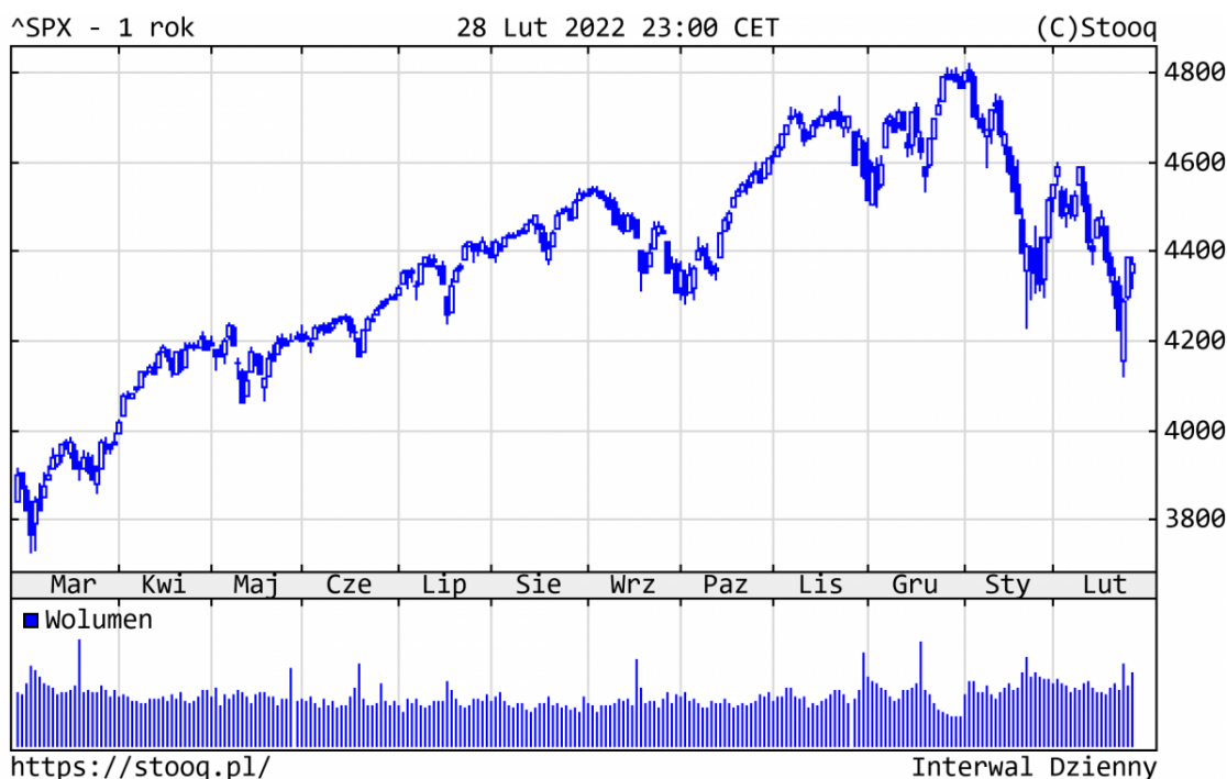
Wykres 1. S&P500 – ostatni rok

W lutym najważniejszym wydarzeniem była bezprecedensowa agresja Rosji na Ukrainę. Inwestorzy reagowali nerwowo jeszcze przed wybuchem wojny. Apogeum spadków miało miejsce w dniu inwazji - 24 lutego. Według stanu na koniec lutego indeksy giełdowe zanotowały następujące spadki, licząc od początku roku: S&P500 o 8,2%, Nasdaq o 12,1%, DAX o 9,0%.