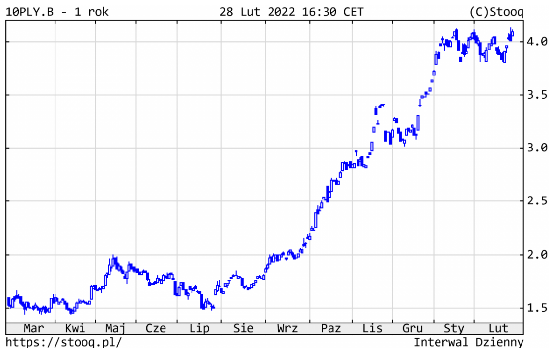
Wykres 4. Rentowność 10-letnich polskich obligacji skarbowych – ostatni rok

ok. 4%. Rentowność amerykańskich 10-latek wzrosła do 1,82%, a niemieckich do 0,13%. Głównym powodem były oczekiwania na normalizację polityki pieniężnej przez banki centralne. Koniunktura na polskim rynku papierów dłużnych korporacyjnych nadal była dobra.