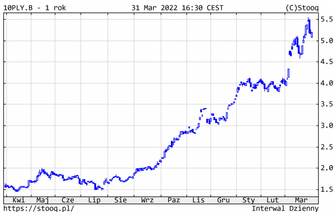
Wykres 4. Rentowność 10-letnich polskich obligacji skarbowych – ostatni rok

W przypadku surowców mieliśmy do czynienia ze sporymi wahaniami cen . Oczy wszystkich inwestorów nadal zwrócone były w kierunku ropy naftowej. Podrożała ona w pewnym momencie aż do 130 dolarów za baryłkę, kończąc marzec na poziomie 100 dolarów (+33% w br.). Złoto podrożało do 1.950 dolarów za uncję (+7%). Cena drugiego metalu szlachetnego – srebra – zwyżkowała w podobnej skali do 25,1 USD za uncję (+8%). Miedź podrożała do 4,75 dolarów za funt (+6%).