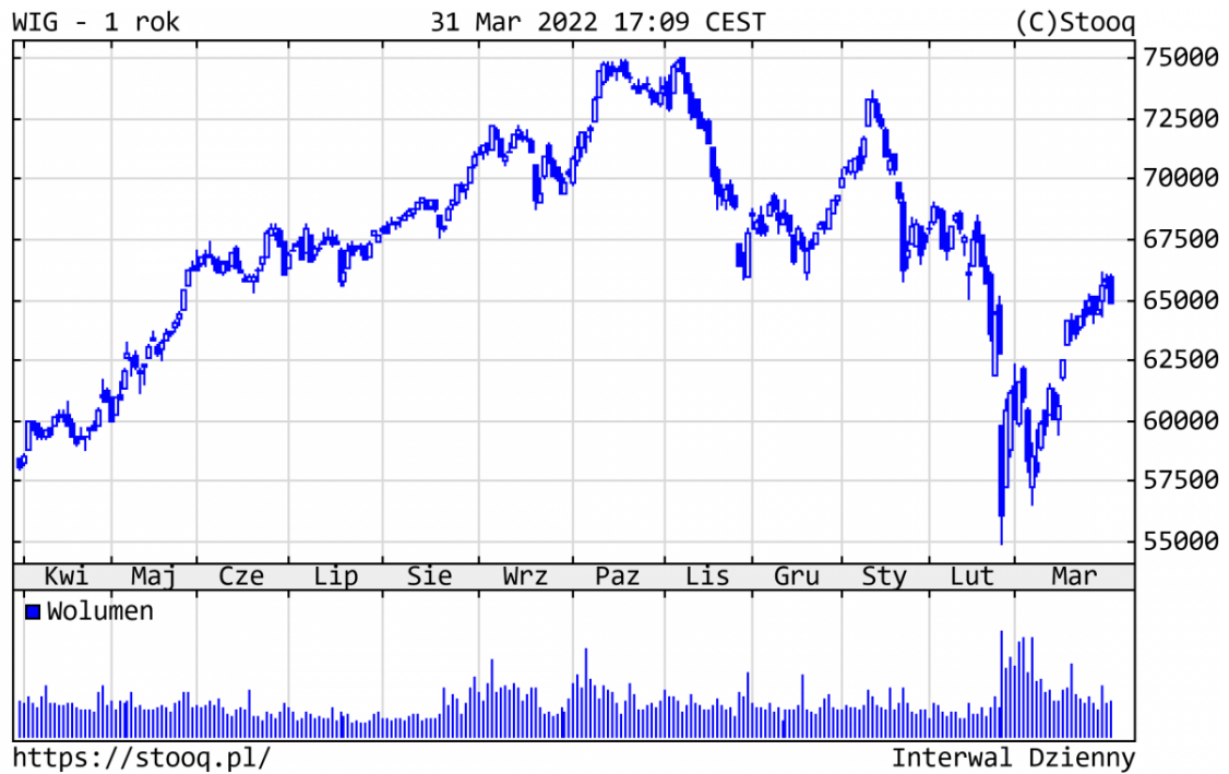
Wykres 2. WIG - ostatni rok