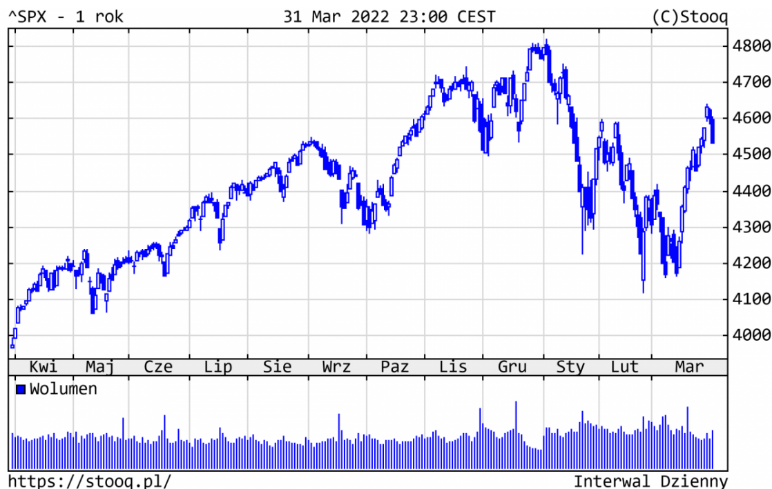
Wykres 1. S&P500 – ostatni rok

W marcu najważniejszym wydarzeniem (oprócz trwającej wojny na Ukrainie) było odreagowanie rynków akcji po wyprzedzący styczniowo-lutowej. Skala odbicia mogła usatysfakcjonować nawet rynkowych optymistów. Według stanu na koniec I kwartału, główne indeksy giełdowe zanotowały następujące stopy zwrotu: S&P500 -5,0%, Nasdaq -9,1%, DAX -9,3%.