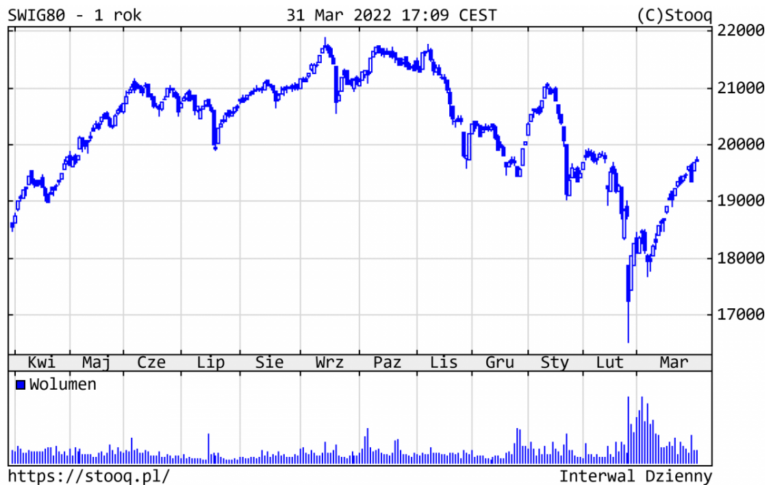
Wykres 3. sWIG80 - ostatni rok

Szeroki rynek polskich spółek zachował się nadspodziewanie dobrze, sWIG80 spadł w br. zaledwie o 1,7%. Najbardziej na wartości zyskały: Lubawa (+162%), Ursus (+110%) czy Bogdanka (+77%). Straciły za to: Mabion (-51%), TEN (-44%) czy Kernel (-42%).