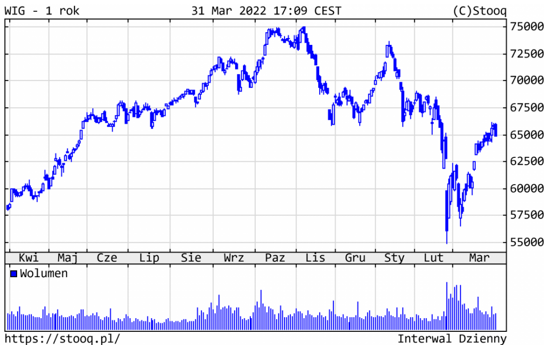
Wykres 3. WIG - ostatni rok

Polskie akcje również zanotowały imponujące odbicie. Po marcu WIG zmniejszył stratę do 6,3%, co jest wynikiem przyzwoitym, biorąc pod uwagę bliskość konfliktu. Z blue chips najlepiej zachowywały się spółki surowcowe: JSW (+123%) i KGHM (+24%). Na drugim biegunie znalazły się spółki z sektora detalicznego: CCC -44% i LPP -33%.