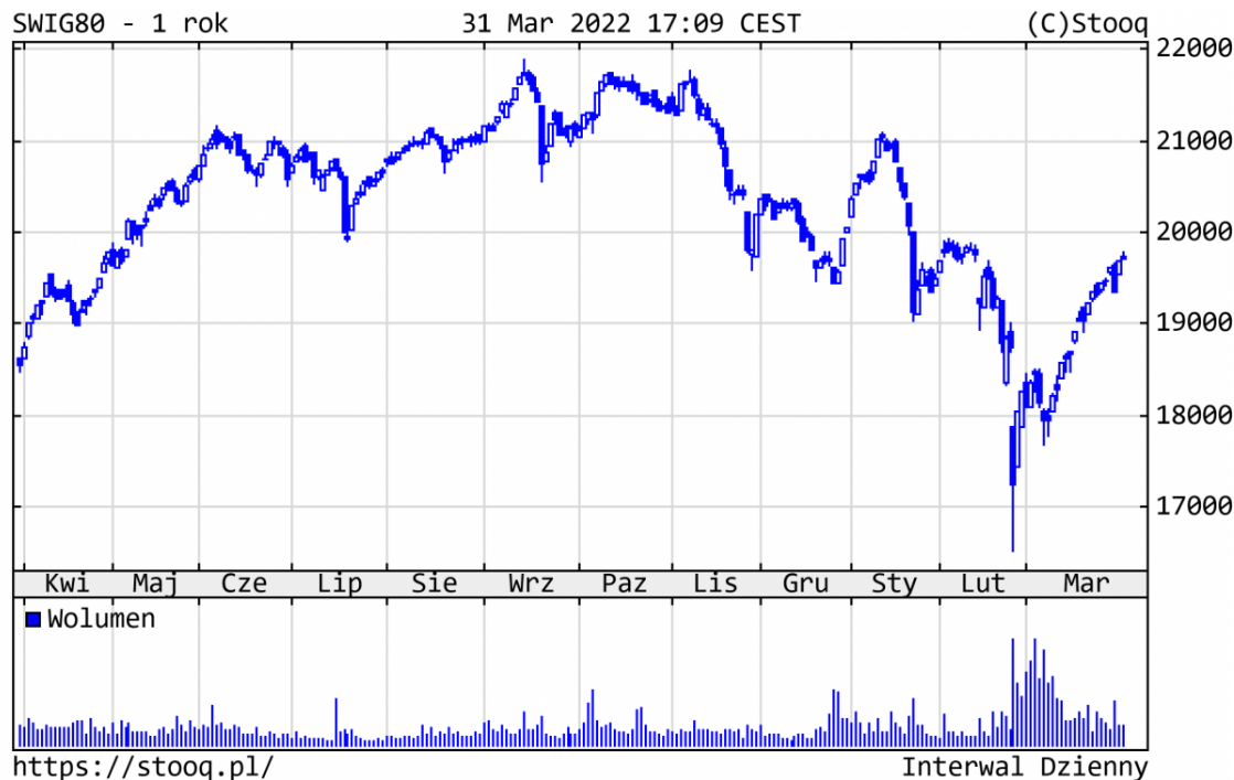
Wykres 4. sWIG80 – ostatni rok

Szeroki rynek polskich spółek zachował się nadszpodziewanie dobrze, sWIG80 spadł w br. zaledwie o 1,7%. Najbardziej na wartości zyskały: Lubawa (+162%), Ursus (+110%) czy Bogdanka (+77%). Straciły za to: Mabion (-51%), TEN (-44%) czy Kernel (-42%).