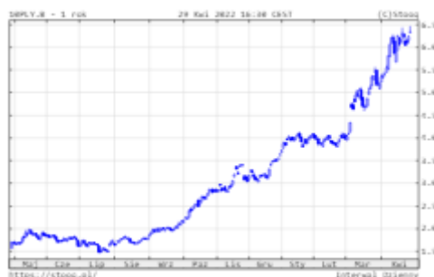
Wykres 4. Rentowność 10-letnich polskich obligacji skarbowych - ostatni rok

Ceny polskich obligacji skarbowych o stałym oprocentowaniu nadal wyraźnie osłabiały się. W przypadku instrumentów 10-letnich rentowność wzrosła już do 6,34%. Z kolei rentowność amerykańskich 10-latek wzrosła do 2,94%, a niemieckich do 0,94%. Głównym powodem były kolejne bardzo wysokie odczyty inflacyjne i oczekiwania na normalizację polityki pieniężnej przez banki centralne. Koniunktura na polskim rynku papierów dłużnych korporacyjnych nadal była dobra.