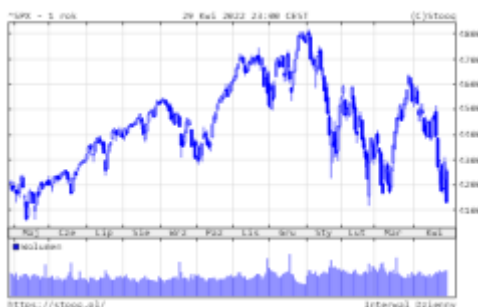
Wykres 1. S&P500 – ostatni rok

Po udanym marcu, w kwietniu rynki finansowe powróciły do tendencji spadkowej. Według stanu na koniec minionego miesiąca, główne indeksy giełdowe zanotowały następujące stopy zwrotu: S&P500 -13,3%, Nasdaq -21,1%, DAX -11,3%.