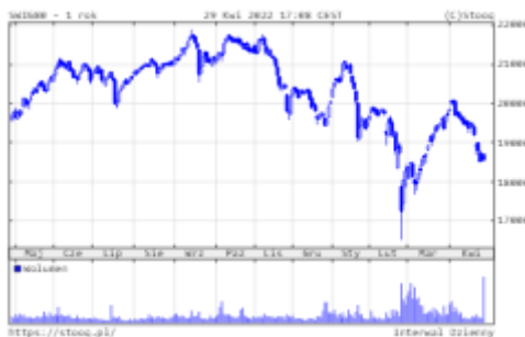
Wykres 3. SWIG80 – ostatni rok

Bogdanka (+67%). Straciły za to: TEN (-55%) czy Kernel (-54%).