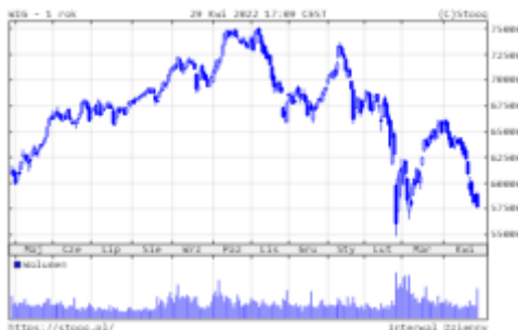
Wykres 2. WIG – ostatni rok

Polskie akcje również zanotowały korektę. Po kwietniu WIG zwiększył stratę do 16,7%. Z blue chips najlepiej zachowywały się spółki surowcowe i energetyczne: JSW (+94%) i PGE (+23%). Na drugim biegunie znalazły się spółki z sektora detalicznego: CCC -50% i LPP -45%.