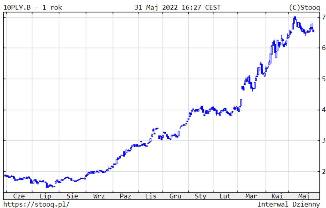
Wykres 4. Rentowność 10-letnich polskich obligacji skarbowych – ostatni rok

Ceny polskich obligacji skarbowych o stałym oprocentowaniu wyhamowały spadki. W przypadku instrumentów 10-letnich rentowność wzrosła nieznacznie do 6,53%. Z kolei rentowność amerykańskich 10-latek nieco spadła do 2,85%, a niemieckich wzrosła do 1,12%. Głównym czynnikiem kształtującym koniunkturę były bardzo wysokie odczyty inflacyjne i oczekiwania na normalizację polityki pieniężnej przez banki centralne. Sytuacja na polskim rynku papierów dłużnych korporacyjnych nadal była dobra.