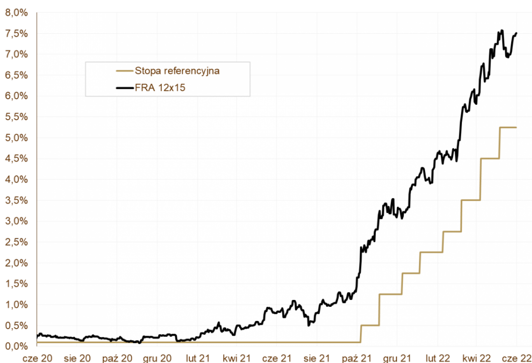
WYKRES 3. Stopa NBP i oczekiwany WIBOR3M za rok.

wzrostowe. Pewne jest jednak, że podwyższona zmienność z nami pozostanie. Wśród czynników, które odpowiadają za odwrócenie tendencji spadkowych warto wymienić: znaczne zmniejszenie umorzeń w branży TFI, wysoką rentowność portfeli po podwyżkach stawek Wibur, cofnięcie agresywnych oczekiwań na zacieśnienie monetarne, nadchodzące spowolnienie gospodarcze i powrót inwestorów zagranicznych na nasz rynek obligacji skarbowych. To powyższe zestawienie nadal będzie sprzyjało inwestycjom w dług skarbowy w kolejnych miesiącach, dlatego warto wykonać pierwszy krok i już teraz część środków ulokować w fundusze dłużne . Skala przeceny była bezprecedensowa, więc taka okazja może się długo nie powtórzyć.