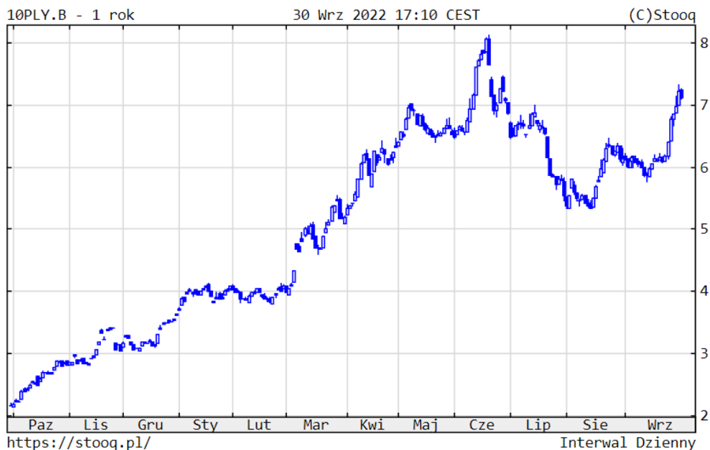
Wykres 4. Rentowność 10-letnich polskich obligacji skarbowych – ostatni rok

Ceny polskich obligacji skarbowych we wrześniu korygowały się drugi miesiąc z rzędu, ale nie pogłębiły czerwcowego dołka, co jest informacją pozytywną. W przypadku instrumentów 10-letnich rentowność wrosła do 7,12%. Z podobnym zachowaniem mieliśmy do czynienia z obligacjami na całym świecie. Rentowność amerykańskich 10-latek wzrosła do 3,83%, a niemieckich do 2,12%. Głównym czynnikiem kształtującym koniunkturę były obawy inflacyjne i oczekiwania na kolejne podwyżki stóp jesienią. Sytuacja na polskim rynku papierów dłużnych korporacyjnych nadal była dobra.