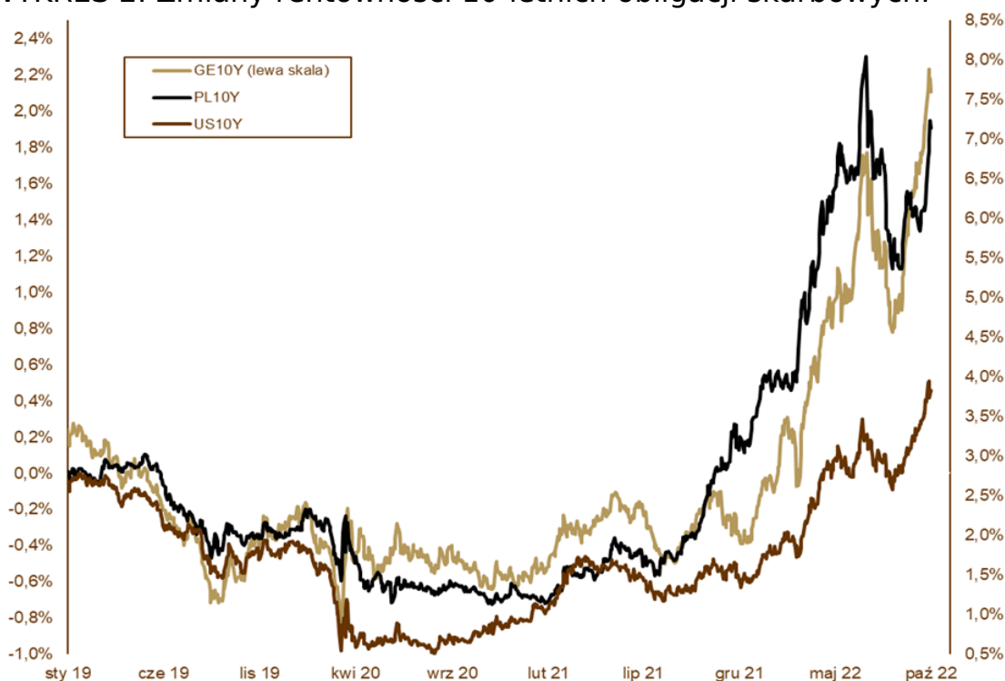
WYKRES 2. Zmiany rentowności 10-letnich obligacji skarbowych.

brytyjskich aktywów. Mocno tracił funt i długoterminowe obligacje. Dopiero wycofanie się z pomysłów obniżki podatków oraz zapowiedź skupu aktywów przez Bank Anglii ustabilizowały rynek. Jednak cały miesiąc wpisał się w tegoroczne, słabe tendencje rynkowe. Rentowności 10-letnich obligacji amerykańskich wzrosły we wrześniu z 3,20% do 3,83%, 10-letnich niemieckich Bundów z 1,54% do 2,11%, a 10-letnich brytyjskich Giltów z 2,80% aż do 4,09%. We wrześniu doszło do trwałego przebiccia parytetu na kursie EUR/USD. Polskie obligacje poddały się zagranicznym tendencjom. Nie pomogła nawet decyzja RPP o pozostawieniu stóp procentowych bez zmian z początku października. Rentowność 10-letnich obligacji skarbowych wzrosła we wrześniu z 6,13% do 7,15%, 5-letnich z 6,65% do 7,37%, a dwulatek z 6,99% do 7,40%. Najbardziej ucierpiały obligacje długoterminowe, które są mocniej „związane” z zagranicą. Krótki koniec krzywej rentowności był pod wpływem zaskakująco wysokiego odczytu CPI i nawet stonowane wypowiedzi członków Rady Polityki Pieniężnej nie uchroniły go przed przeceną. Mocny dolar nie sprzyja inwestycjom na rynkach wschodzących, co poskutkowało osłabieniem złotego. Do euro stracił w miesiąc prawie 3%, a do dolara amerykańskiego ponad 5%, przebijając chwilowo magiczną liczbę 5.