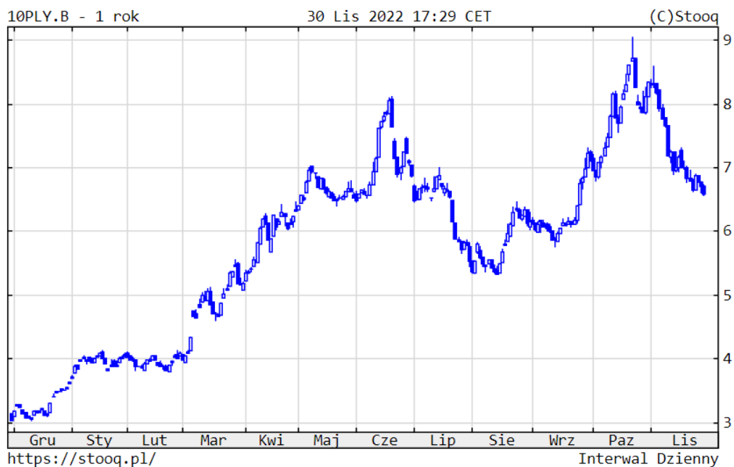
Wykres 4. Rentowność 10-letnich polskich obligacji skarbowych – ostatni rok

Na rynkach obligacji doszło do wyraźnej poprawy. W przypadku polskich instrumentów 10-letnich rentowność spadła istotnie do 6,58%, amerykańskich do 3,61%, a niemieckich do 1,89%. Głównym czynnikiem kształtującym koniunkturę były tym razem nadzieje na zakończenie procesu podwyższania stóp procentowych przez banki centralne w najbliższych miesiącach. Sytuacja na polskim rynku papierów dłużnych korporacyjnych nadal była stabilna.