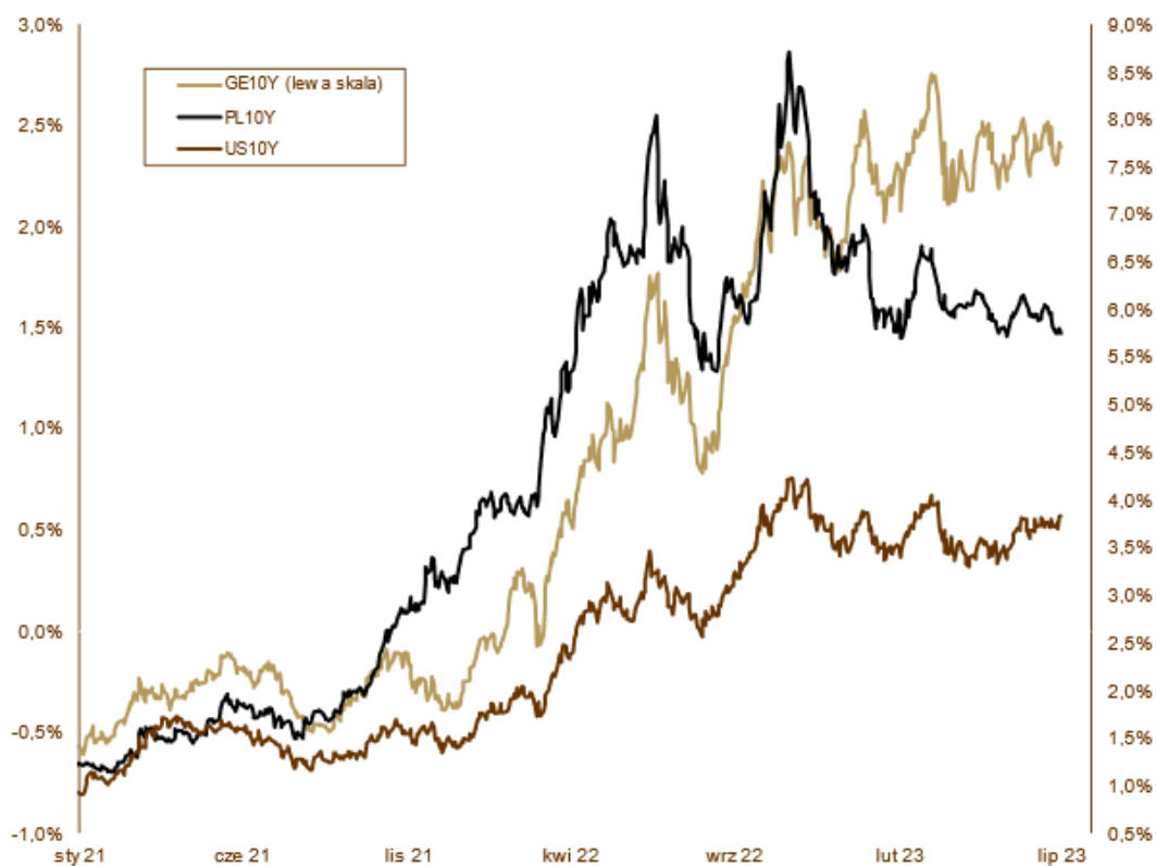
WYKRES 2. Zmiany rentowności 10-letnich obligacji skarbowych.

Rynek wycenia bowiem sześć obniżek stóp w horyzoncie roku, z czego cztery miałyby nastąpić już w przeciągu najbliższego półrocza. Podczas lipcowego posiedzenia RPP nie zmieniła stóp procentowych, ale poznaliśmy kilka ciekawych informacji. Po pierwsze, cykl podwyżek stóp procentowych został oficjalnie zakończony (choć i tak nikt nie wierzył w jego kontynuację). Po drugie, prezes Adam Glapiński zapowiedział rozpoczęcie cyklu luzowania już po wakacjach . Aby tak się stało muszą zostać spełnione dwa warunki. Inflacja konsumencka musi spaść poniżej 10% oraz projekcje inflacyjne muszą wskazywać na silny trend dezinflacyjny w kolejnych miesiącach. Szanse na pierwsze obniżki widzimy już we wrześniu . Polskie skarbówki kontynuowały pozytywny trend z poprzednich miesięcy. Rentowność 10-letnich obligacji spadła z 6,02% do 5,76%, 5-letnich z 5,94% do 5,63%, a dwulatek z 5,91% do 5,77%. Złotówka nadal umacniała się. Kurs euro spadł z 4,53 do 4,43, a dolara z 4,26 do 4,06.