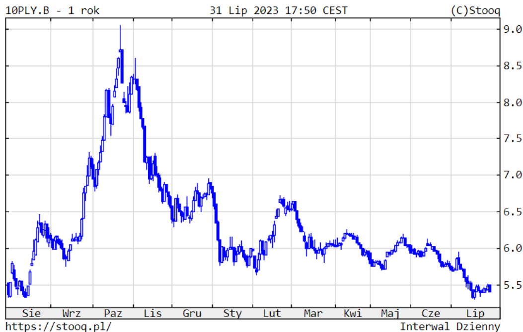
Wykres 4. Rentowność 10-letnich polskich obligacji skarbowych – ostatni rok

Na polskim rynku obligacji kontynuowana była hossa. W przypadku naszych instrumentów 10-letnich rentowność spadła do 5,42%, amerykańskich wzrosła do 3,97%, a niemieckich do 2,45%. Sytuacja na polskim rynku papierów dłużnych korporacyjnych była bardzo dobra. Sprzyja znaczący napływ środków do polskich funduszy, które w br. notują znakomite wyniki inwestycyjne.