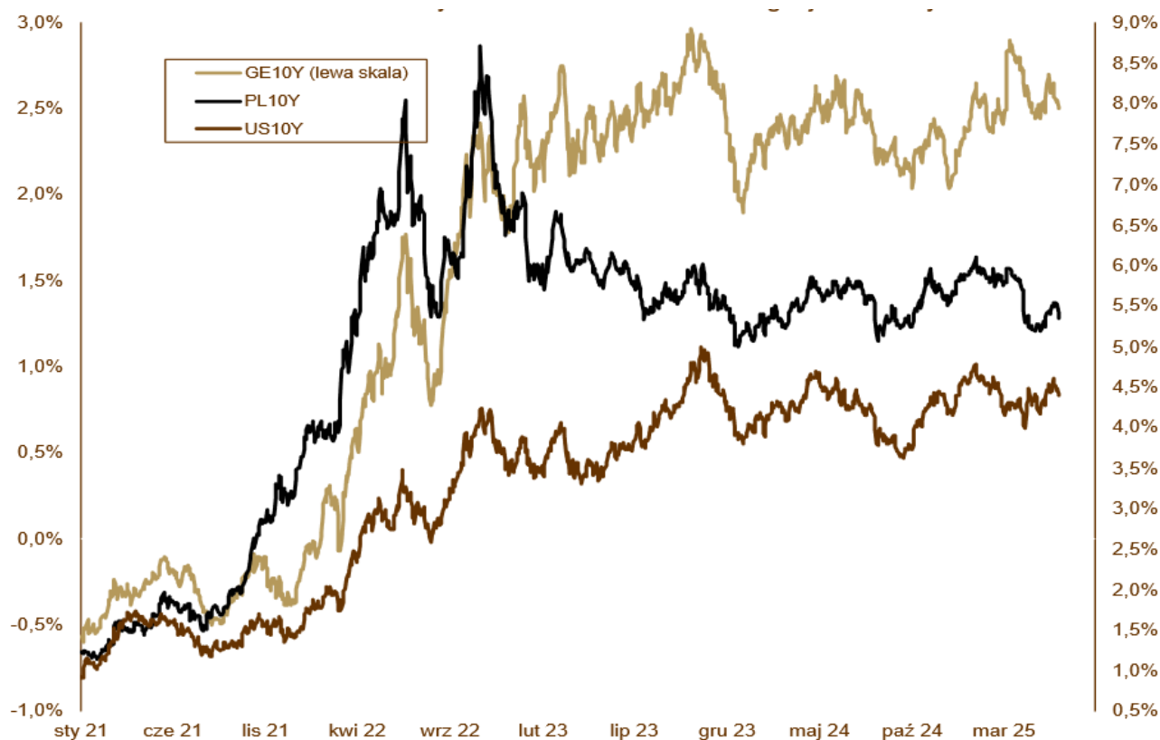
WYKRES 2. Zmiany rentowności 10-letnich obligacji skarbowych.

Trumpa podtrzymuje kurs konfrontacyjny w relacjach handlowych. W maju zapowiedziano rewizję układów celnych z Unią Europejską, co wywołało krótkoterminowe wzrosty zmienności na rynku eurodolara oraz wzrosty rentowności na świecie. Sytuacja gospodarcza w USA nie była klarowna. Rynek pracy nadal rośnie, choć w niższym tempie niż jeszcze kilka miesięcy temu. Wskaźniki sentymentu oscylują wokół neutralnych poziomów. Choć wzrost gospodarczy słabnie, Fed utrzymuje stanowisko „wait and see” . Jerome Powell w połowie maja podkreślił, że kolejne decyzje będą zależne głównie od danych o inflacji bazowej, która wciąż nie wróciła do celu. Rentowności amerykańskich 10-letnich obligacji ponownie wzrosły – z 4,16% do 4,40%, co rynek odczytał jako sygnał ograniczonej przestrzeni do luzowania polityki w tym roku. Niemieckie Bundy też były pod presją. Rentowność w segmencie 10-letnim wzrosła z 2,44% do 2,50%.