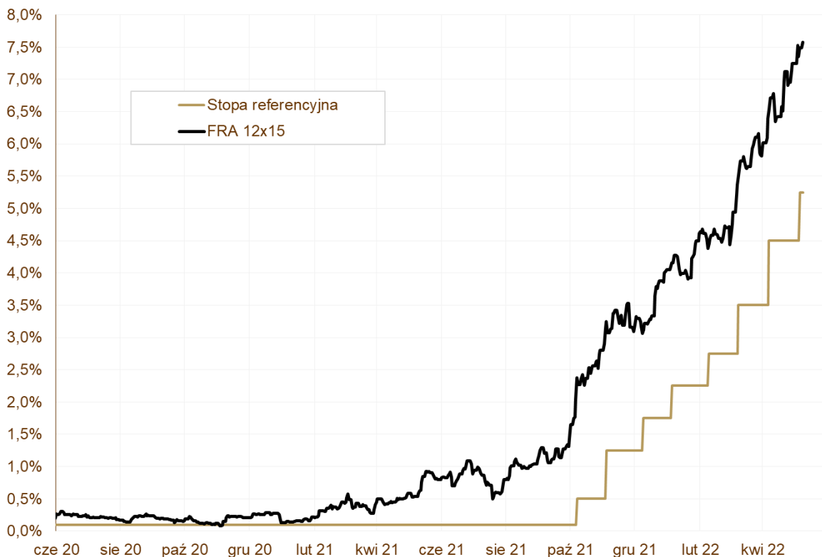
WYKRES 3. Stopa NBP i oczekiwany WIBOR3M za rok.